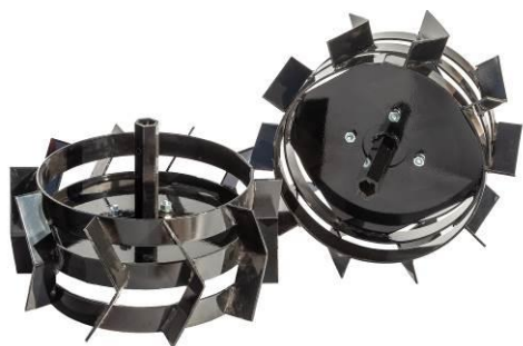
Set roți metalice 400 mm sau 500 mm cu adaptoare de fixare