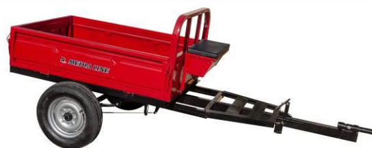
Remorcă 400 kg sau 500 kg